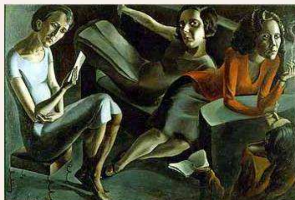
Tertulia (1929) de Ángeles Santos. Museo Reina Sofía, Madrid

Se debatirá sobre la actual demanda de la sociedad civil de una mayor transparencia en la Administración, tanto en la organización de la misma como en la gestión de nuestros gobernantes.