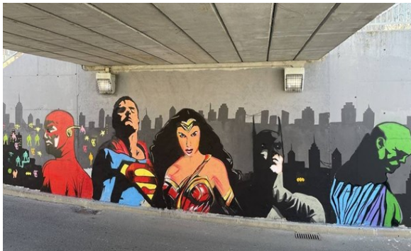
Parte del graffitti elaborado en las I Jornadas de Cultura y Discapacidad 2021